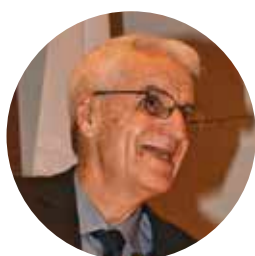
Dinos Michaelides (CYP) President of the National Olympic Committee and the National Olympic Academy of Cyprus

Cela dit, je n'ai aucunement l'intention de minimiser la force, l'inspiration et l'aspiration qui émanent des Jeux Olympiques. Ils ont indiscutablement changé ma vie positivement, en me poussant mentalement et physiquement vers l'épreuve ultime, en développant mes expériences de vie, en m'exposant à de bons et à de mauvais modèles. Ils m'ont également ouvert les portes d'opportunités professionnelles, et je leur en suis reconnaissant pour toujours. Il s'agit d'un événement unique à plusieurs égards. Deux-cent-six nations qui vivent ensemble dans un village et qui concourent dans un cadre hautement compétitif, sans rancœur, en respectant les mêmes règles! Les hommes et les femmes politiques ne peuvent que rêver de parvenir à une telle unité universelle. Il ne faut pas s'étonner s'ils veulent tous assister à la cérémonie d'ouverture et faire cette expérience.»