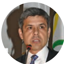
Professor Cesar R. Torres (USA)

Είναι φανερό ότι οι κοινωνικοί ρόλοι που ανατίθενται στη συγκεκριμένη κοινωνική ομάδα, δεν σχετίζονται μόνο με τις πλευρές ανάπτυξης του ατόμου αλλά και με πλευρές της κοινωνικής ζωής που παρουσιάζουν αντικρουόμενους μεταξύ τους προσανατολισμούς ως προς τις αξίες. Η δυσκολία και η πολυπλοκότητα όλων αυτών των ρόλων απαιτεί από τον αθλητή να είναι «υπεράνθρωπος».