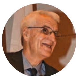
Dinos Michaelides (CYP) President of the National Olympic Committee and the National Olympic Academy of Cyprus

Φυσικά, λέγοντας αυτό δεν θέλουμε καθόλου να υποβαθμίσουμε τη δύναμη, την έμπνευση και τις προσδοκίες που πηγάζουν από τους Ολυμπιακούς Αγώνες. Είναι σίγουρο ότι αυτοί οι Αγώνες άλλαξαν τη ζωή μου προς το καλύτερο, παρακινώντας με πνευματικά και σωματικά να καταβάλλω υπέρτατες προσπάθειες, αυξάνοντας τις εμπειρίες μου, δείχνοντάς μου τα καλά και τα κακά πρότυπα. Επίσης, οι Αγώνες μου έδωσαν επαγγελματικές ευκαιρίες και γι’ αυτόν τον λόγο θα είμαι για πάντα ευγνώμων. Πρόκειται για μια διοργάνωση που είναι μοναδική από πολλές απόψεις. Διακόσια έξι έθνη που συμβιώνουν μέσα σε ένα χωριό, που αθλούνται μέσα σε ένα άκρως ανταγωνιστικό περιβάλλον, χωρίς μνησικακίες, ακολουθώντας τους ίδιους κανόνες! Οι πολιτικοί μόνο στα όνειρά τους μπορούν να βρουν τέτοια παγκόσμια ενόπια. Δεν είναι συνεπώς απορίας άξιο το γεγονός ότι πολλοί επιθυμούν να παρευρεθούν στην τελετή έναρξης και να ζήσουν αυτή την εμπειρία.»